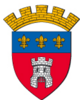
VILLE DE TOURNAI